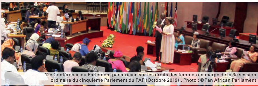
12e Conférence du Parlement panafricain sur les droits des femmes en marge de la 3e session ordinaire du cinquième Parlement du PAP (Octobre 2019)..