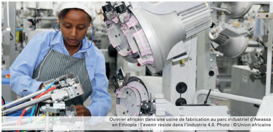
Ouvrier africain dans une usine de fabrication au parc industriel d'Awassa en Ethiopie : l'avenir réside dans l'industrie 4.0.

Les chefs d'État et de gouvernement de l'UA