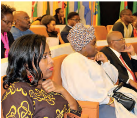
Diaspora africaine aux États-Unis.