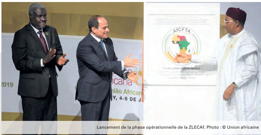
Lancement de la phase opérationnelle de la ZLECAF.