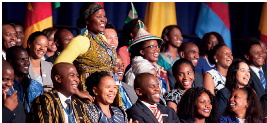
Initiative des jeunes leaders africains.